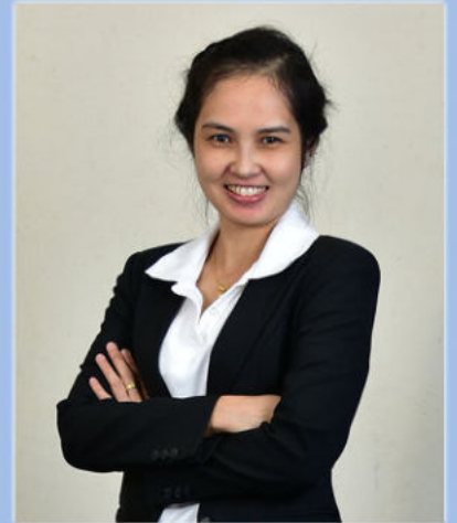
บรรณาธิการ

จุลสารนิติศาสตร์ คณะนิติศาสตร์ มหาวิทยาลัยหัวเฉียวเฉลิมพระเกียรติ เป็นจุลสารเพื่อการประชาสัมพันธ์คณะนิติศาสตร์ เผยแพร่ความรู้ทางด้านกฎหมายและกิจกรรมของนักศึกษาที่ได้เข้าร่วม อันจะเป็นประโยชน์แก่นักศึกษาวิชากฎหมาย รวมทั้งบุคคลทั่วไปที่ต้องการได้รับความรู้กฎหมายเพิ่มเติม หวังเป็นอย่างยิ่งว่าจุลสารฉบับนี้จะเป็นประโยชน์แก่ผู้ที่สนใจ และให้บริการความรู้ด้านกฎหมายไปพร้อมกัน