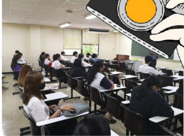
วันที่ 9 ตุลาคม 2563 จัดกิจกรรม “ผู้บริหารพบนักศึกษา” ประจำปีการศึกษา 2563