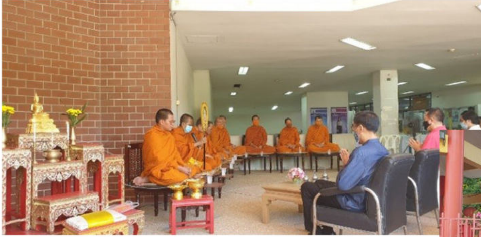
วันที่ 25 สิงหาคม 2563 ทำบุญคุณะประจำปี