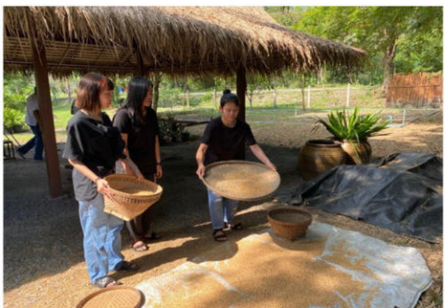
วันที่ 9 พฤศจิกายน 2563 จัดโครงการคุณธรรมนำชีวิตตามแนวคิดปรัชญาเศรษฐกิจพอเพียง และนิติศาสตร์จิตอาสา ณ วัดดงละครและศูนย์เรียนรู้ภูกะเที๋ยง จังหวัดนครนายก