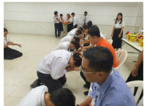
วันที่ 10 กันยายน 2563 คณะกรรมการนักศึกษาคณะนิติศาสตร์จัดพิธีไหว้ครู และกิจกรรมรับขวัญน้องสู่คณะนิติศาสตร์ ประจำปีการศึกษา 2563