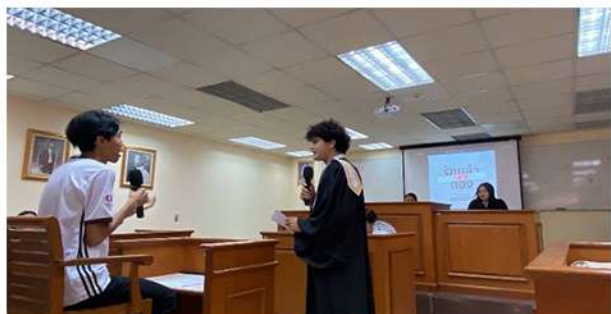
วันที่ 24 เมษายน 2567 นักศึกษาชั้นปี 3 คณะนิติศาสตร์จัดการแสดงศาลจำลองโดยใช้ชื่อการแสดงว่า “รักแล้วต้องไป (ศาล) ไหน” ณ ห้องศาลจำลอง