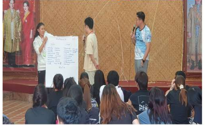
วันที่ 8 -10 มกราคม 2567 คณะนิติศาสตร์ จัดโครงการ “พัฒนาศักยภาพนักศึกษา” ประจำปีการศึกษา 2566 ณ ค่ายสุรัสวดี อุทยานแห่งชาติเขาใหญ่