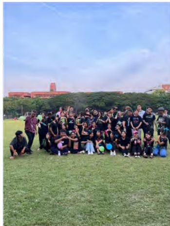
● วันที่ 25 ตุลาคม 2565 คณะกรรมการนักศึกษา จัดโครงการนิตสัมพันธ์ ประจำปีการศึกษา 2565