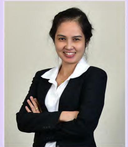
บรรณาธิการ

จุลสารนิติศาสตร์ คณะนิติศาสตร์ มหาวิทยาลัยหัวเฉียวเฉลิมพระเกียรติ เป็นจุลสารเพื่อการประชาสัมพันธ์คณะนิติศาสตร์ เผยแพร่ความรู้ทางด้านกฎหมายและกิจกรรมของนักศึกษาที่ได้เข้าร่วม อันจะเป็นประโยชน์แก่นักศึกษาวิชากฎหมาย รวมทั้งบุคคลทั่วไปที่ต้องการได้รับความรู้กฎหมายเพิ่มเติม หวังเป็นอย่างยิ่งว่าจุลสารฉบับนี้จะเป็นประโยชน์แก่ผู้ที่สนใจ และให้บริการความรู้ด้านกฎหมายไปพร้อมกัน