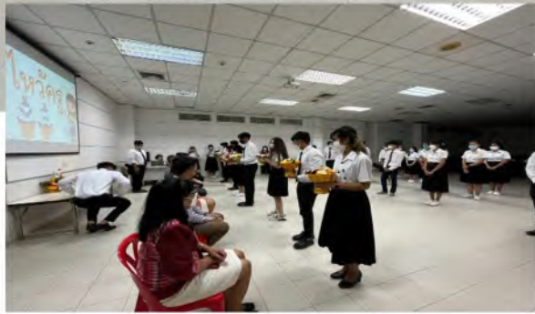
● วันที่ 15 กันยายน 2565 คณะกรรมการนักศึกษาจัดพิธีไหว้ครูและบายศรีสู่ขวัญ ประจำปีการศึกษา 2565