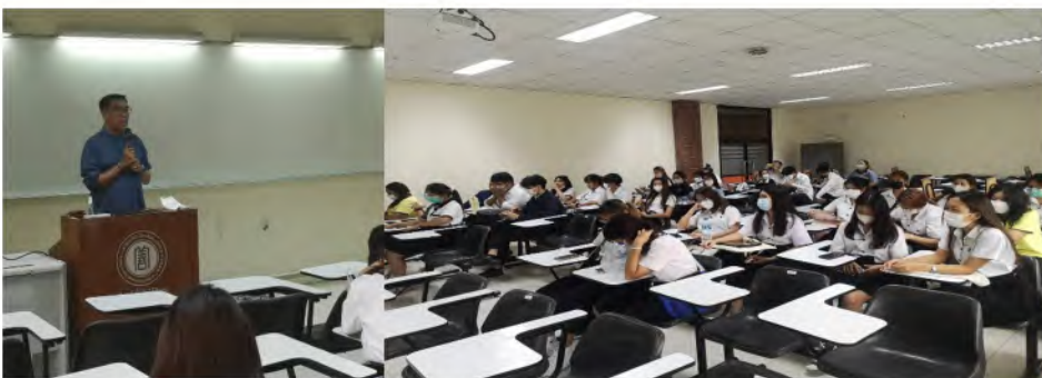
● วันที่ 28 ตุลาคม 2565 คณบดีและรองคณบดี “ผู้บริหารพบนักศึกษา” ภาคปกติ ชั้นปีที่ 1-4 ครั้งที่ 1 ประจำปีการศึกษา 2565