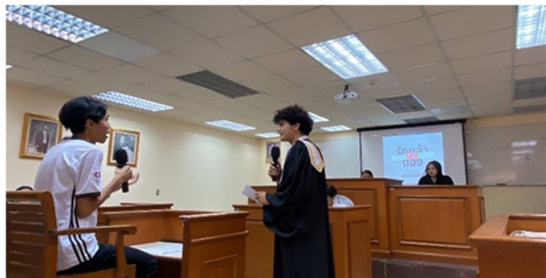
วันที่ 24 เมษายน 2567 นักศึกษาชั้นปี 3 คณะนิติศาสตร์จัดการแสดงศาลจำลองโดยใช้ชื่อการแสดงว่า “รักแล้วต้องไป (ศาล) ไหน” ณ ห้องศาลจำลอง