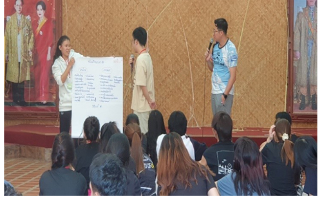
วันที่ 8 -10 มกราคม 2567 คณะนิติศาสตร์ จัดโครงการ “พัฒนาศักยภาพนักศึกษา” ประจำปีการศึกษา 2566 ณ ค่ายสุรัสวดี อุทยานแห่งชาติเขาใหญ่