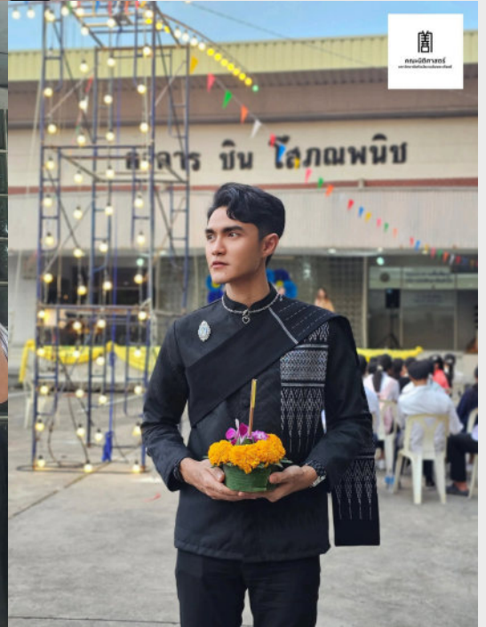
คณะนิติศาสตร์ร่วมสืบสานประเพณีลอยกระทง ประจำปีการศึกษา 2568